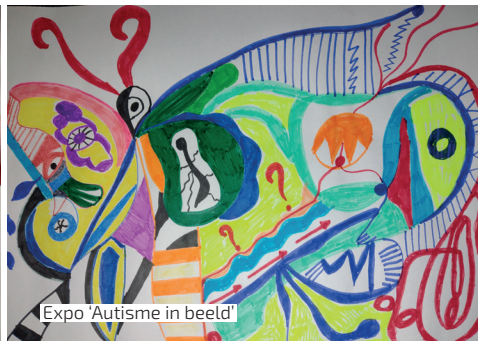
Expo 'Autisme in beeld'